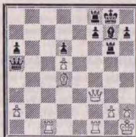
DIAGRAMME N° 5

Question n° 471. A vous de jouer. Et maintenant l'assaut final ! Les Blancs jouent et gagnent (2 points).