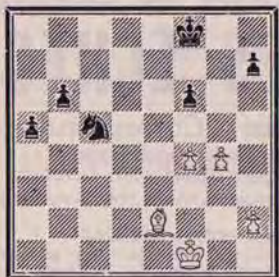
Une petite finale. Trait aux Noirs.