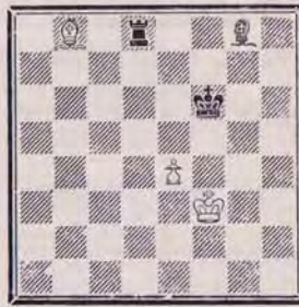
1366 — D. BRIET (Paris)