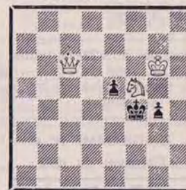
DIAGRAMME N° 2

Question n° 420. A vous de jouer ! Comment obtenir l'avantage ? (3 points).