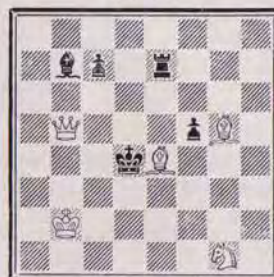
1336 — T. LINSS R.D.A.