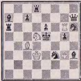
1365 — C. GOUMONDY (Paris)