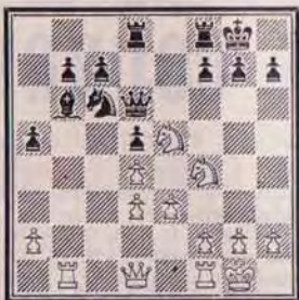
La foncée des Noirs.