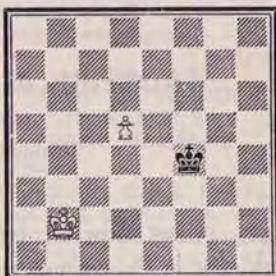
DIAGRAMME N° 4

Dans la brochure « A.J.E.C., Premiers Pas », S. Zinser traite de la finale Roi contre Pion de la façon suivante :