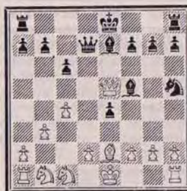
Trait aux Noirs.