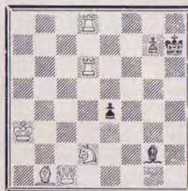
1337 — P. JOLLER Suisse