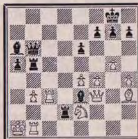
Un petit mat rapide. Trait aux Noirs.