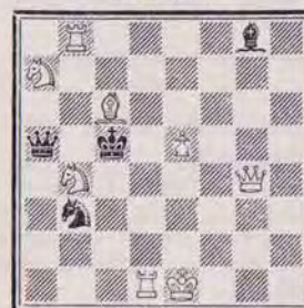
1338 — P. DI SCALA (Vannes)