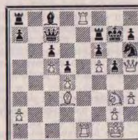
DIAGRAMME N° 5

Le plan de notre examen de position peut-il être réalisé ?