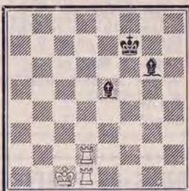
DIAGRAMME N° 4 « Les Tours à l'assaut »

Question n° 452. A vous de jouer ! Comment les Blancs gagnent-ils maintenant ? (2 points).