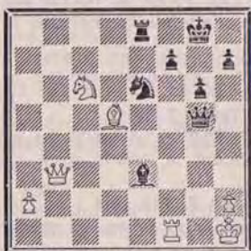
DIAGRAMME N° 3

La variante 6. ... Da1+ 7. Rd2 Txd5+ 8. Dxd5 Da5+ 9. Re2 est suffisamment convaincante pour faire la différence.