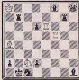
1318 — N. DOLGINOVIC U.R.S.S.

1285 (Gravilov et Bogdanov) : 1. Fe3 /2. Cd2+ Fxd2 3. Cb2/ Dxd3 2. Cd6+ Dxd6 3. Dc2 (et non Dd3 ?) ; 1. ... Dxe4 2. Ce5+ Dxe5 3. Dd3 (et non Dc2 ?) ; 2. ... Rd5 3. Td3 ; 1. ... Dd4 2. Tc3+ Dxc3 3. Cd6 ; 1. ... Fxe3 2. Cb2+ Rd4 3. fxe3. Très joli