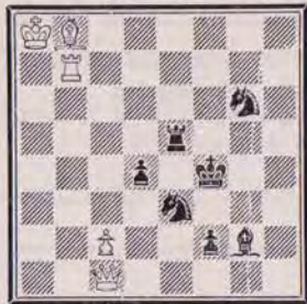
1301 — C. GOUMONDY (Paris)

5 + 7 a) Diagramme h2 ≠ b) échanger Fb8 et Dbc1