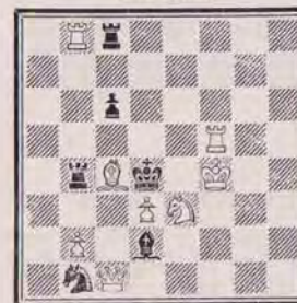
1282 — P. DI SCALA (Vannes)