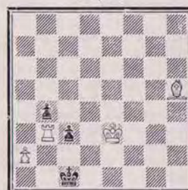
1339 — R. SEBILLOTTE (Dijon)