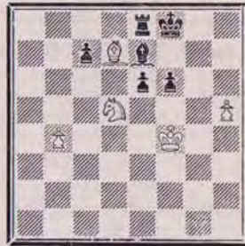
1342 — O. SARBU Roumanie

1309 (Dolginevic) : 1. Rd3 Th3 2. De2 Td7. 1. Rf1 Tf7 2. Fe2 Th1. Beau problème (M. Paulé).