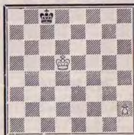
DIAGRAMME N° 5