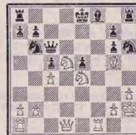
DIAGRAMME N° 2