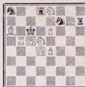
1280 — P. DI SCALA (Vannes)