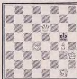
1279 — R. SEBILLOTTE (Dijon)

Envoyez vos solutions avant le 20 mars 1985