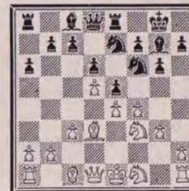
Une bizarre Est-Indienne. Les Noirs vont sanctionner ces nouveautés.