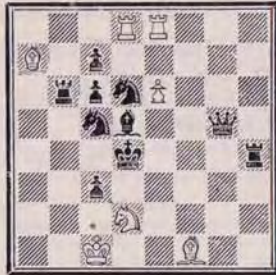
1333 — C. GOUMONDY (France)