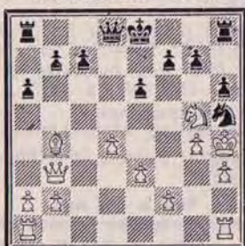
DIAGRAMME N° 2

Car si 2. Rh2 D×g5 gagne le Cavalier, le Pion g4 ne pouvant prendre le Cavalier h5, la Dame donnant mat en g2, et si 2. g×h5 D×g5+, et les Noirs gagnent.