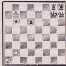
1302 — F.S. BONDARENKO U.R.S.S.

5 + 7 a) Diagramme h2 ≠ b) échanger Fb8 et Dbc1