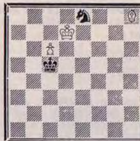
DIAGRAMME N° 1

C'est l'étude du Chess Players Chronicle de Hgrehyf qui nous servira de point de départ: