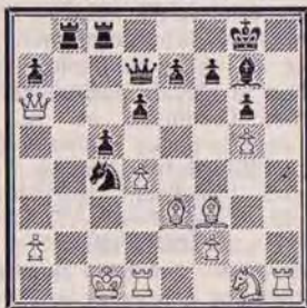
DIAGRAMME N° 2

Question n° 427. 2. D×g5+ f×g5 3. Ch5+ mat (3 points).