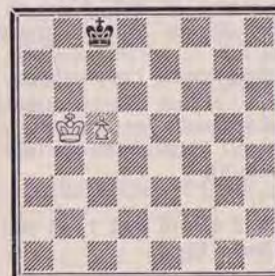
DIAGRAMME N° 2

Si 1. ... Rd8, la position étant symétrique à celle de la question n° 458, les Blancs gagnent évidemment par le coup symétrique de celui que vous venez de trouver !