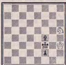
Trait aux Blancs

Changement de décor après le 3 e acte! Donnons le Fou et le Pion aux Noirs et le Cavalier aux Blancs.