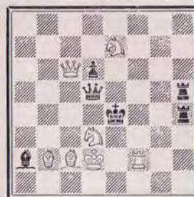
1281 — J.-Y. SPIESS (Paris)