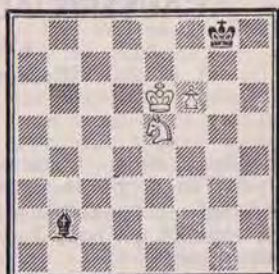
Trait aux Blancs

Continuons notre étude avec une analyse de Horwitz (1851).