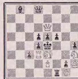
1284 — A.N. BUJANOV U.R.S.S.