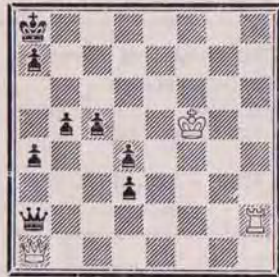
1341 — N. DOLGINOVIC U.R.S.S.