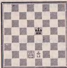
DIAGRAMME N° 3