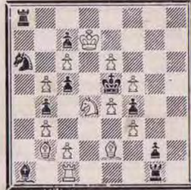
1334 — P.C. POPA Roumanie