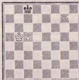
DIAGRAMME N° 1

L'opposition joue un rôle des plus importants dans les fins de partie et décide très souvent du gain ou de la perte de la partie.