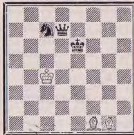
1326 — M. BILY Tchécoslovaquie

1293 (Goumondy) : a) 1. Tg5 Fe1 2. Cd5 T×e4. b) 1. Dg4 Tc5 2. Cf2 F×e3. Très beau (A. Primault). Très belle idée (P. Gaillard).