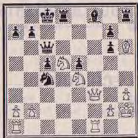
DIAGRAMME N° 3