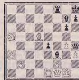
Savoir conclure... Trait aux Noirs.