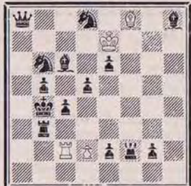
1278 — N. DOLGINOVIC U.R.S.S.