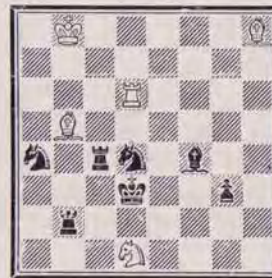
1229 — C. GOUMONDY (Paris)