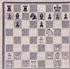
Diagramme analyse, après 17. Cf5 !?. Si 17. ... Td8 18. Cxe7+ Rf8 19. Cd5 ou 19. Cf5 et les Blancs restent avec un Pion de plus.

Pourtant, 17. Cf5 !? pose, de toute évidence, des problèmes plus difficiles aux Noirs que 17. Cxe6 et le chemin à suivre pour égaliser est plus qu'étroit :