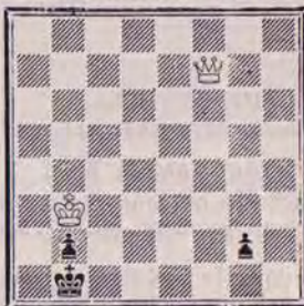
DIAGRAMME N° 5