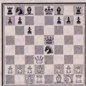
RICHARD RETI Trait aux Blancs Mat en trois coups