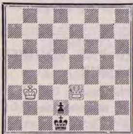
DIAGRAMME N° 4

Malgré les deux pions noirs menaçants, les Blancs gagnent rapidement. Comment ? (2 points).