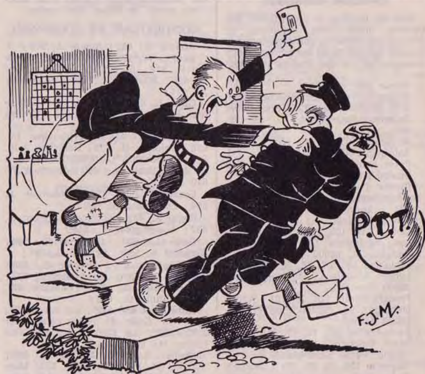
Joueur par correspondance gagnant sa première partie !! (« Chess », 12-1946.)