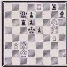
1207 — E.M. BOGDANOV U.R.S.S.