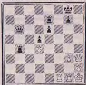
Trait aux Blancs Mat en cinq coups

trouvé le mat en quatre coups en moins d'une minute, sans aucune difficulté. Avec le Pion en g3, comme dans notre diagramme, il lui a fallu quarante minutes pour trouver le mat en cinq coups. Est-ce que nos lecteurs humains pourraient mieux faire ?