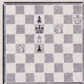
1205 — F. CODRUT Roumanie