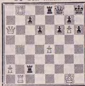
DIAGRAMME N° 3 « De bon matin !... »

ABONNEZ-VOUS ET ABONNEZ VOS AMIS AU « COURRIER DES ECHECS »