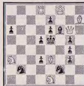
1228 — C. GOUMONDY (Paris)