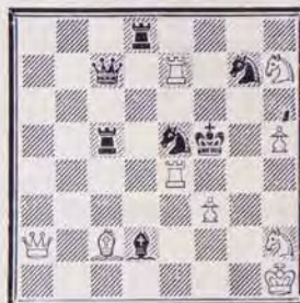
1201 — P. DI SCALA (Vannes)

Envoyez vos solutions avant le 20 avril 1984