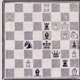
1208 — C. GOUMONDY (Paris)

9 + 8 a) Diagramme h 2 ≠ b) Ch5 en a2 c) Tb5 à la place du CB