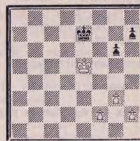
DIAGRAMME N° 5 « Ah, les petits pions !... »

1. Df1! 1. ... Fb2 2. Db1 g6 3. D×b2 mat; ou 1. ... Fc3/d4 2. Dd3 g6 3. D×c3/d4 mat; ou 1. ... Fe5/f6 2. Df5 g6 3. D×e5/f6 mat; ou 1. ... g3 2. Cg6+ h×g6 3. Dh3 mat.