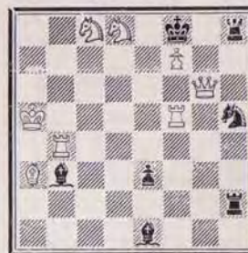
1226 — P. DI SCALA (Vannes)