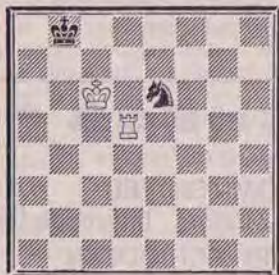
DIAGRAMME N° 1 « Facile »

Nous présentons aujourd'hui quelques finales.