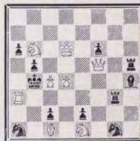
1202 — E. PETITE Espagne