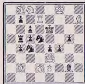
1204 — C. GOUMONDY (Paris)