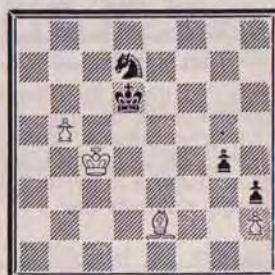
DIAGRAMME N° 6

Il faut trouver la bonne case pour la Dame blanche. Cette case permet une rapide victoire des Blancs. Mais où est-elle ? (4 points).