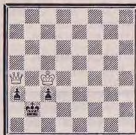
DIAGRAMME N° 3

Si les Noirs jouent : 5. ... c1=Cav.+ . Comment obtenir un gain rapide pour les Blancs ? (2 points).