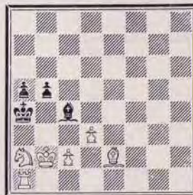
1225 — E.M. BOGDANOV U.R.S.S.

Envoyez vos solutions avant le 20 juillet 1984