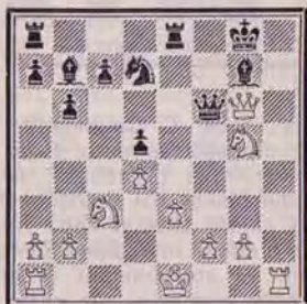
Trait aux Blancs Mat en deux coups

croyablement, le prix n'est que de £ 3.95 (45 F). C'est de la page 209 que j'extrait notre position du mois. En attendant, l'adresse pour tous les renseignements en ce qui concerne ces deux livres étrangers est Miss Carole Saunders, Batsford Academic and Educational, Ltd., 4, Fitzhardinge Street, Londres, W1H OAH, Angleterre.