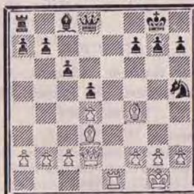
DIAGRAMME N° 4 « Le bon Fou »

Question n° 399. — A vous de jouer! Comment obtenir le gain? (5 points).