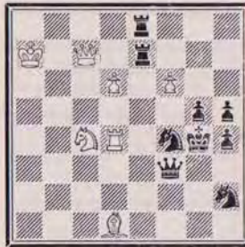
1240 — C. GOUMONDY (Paris)

7 + 9 a) Diagramme h 2 ≠ b) Te8 en d7 c) Oter le CBc4