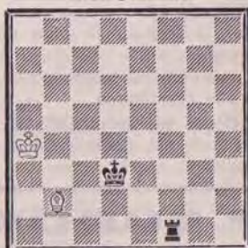
DIAGRAMME N° 2 « Moins facile »

Après 1. Td6 Cg7, les Blancs gagnent. Comment? (2 points).