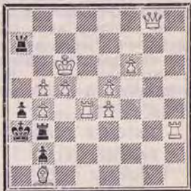
Trait aux Blancs Mat en trois coups