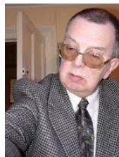
Nikolay KROGIUS (Russie)

Deux grands spécialistes des finales et auteurs de nombreux ouvrages résument la technique gagnante pour le camp ayant le pion par ces 6 étapes, dite aussi méthode de "construction du pont" .