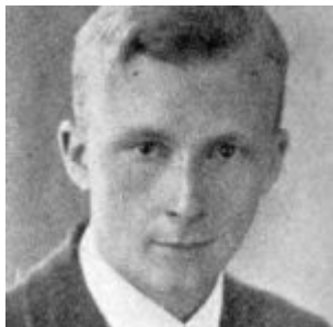
Cecil PURDY (Australie)

1er Champion du Monde par correspondance 1950 – 1953