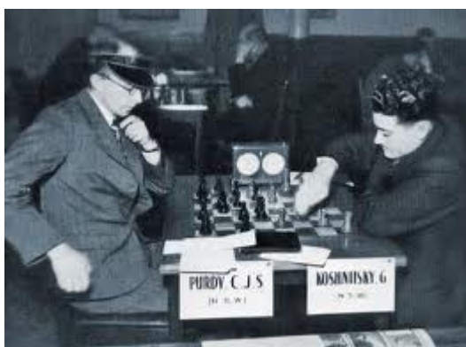
Cecil PURDY devant l'échiquier.

Cecil PURDY était Maître International du jeu d'échecs (1951) et Grand Maître du jeu d'échecs par correspondance (1953), célèbre pour avoir été le premier Champion du monde par correspondance I.C.C.F. entre 1950 et 1953. Il était également l'auteur d'ouvrages échiqués.